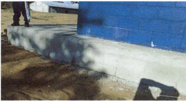
Foto7: Reparacion de cuneta de concreto del lado derecho del establecimiento.