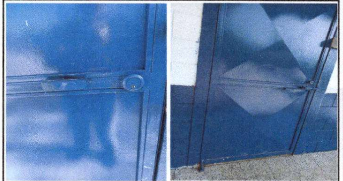
Foto 2: Mantenimiento a estructura de puertas de metal Modulo 1 y 2