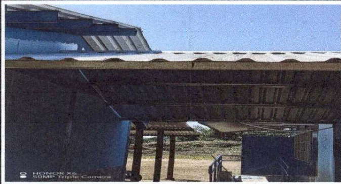
Foto 1: Sustrucción de Lámina por lámina troquelada Aluzinc calibre 26 en el pasillo.