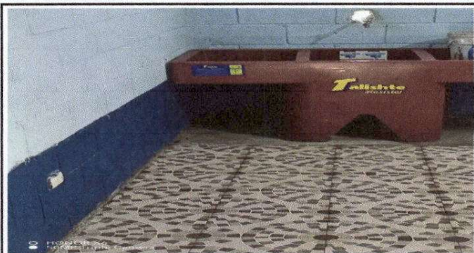
Foto 13: Instalación de pila de plástico de dos lavaderos en la cocina.