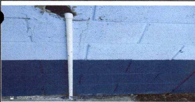
Foto 11: Sustitucion de tuberia PVC de línea principal aguas negras en los baños.