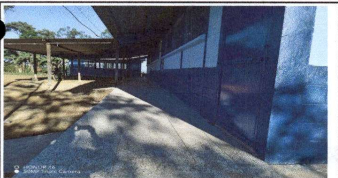
Foto 5: Sustrucción de piso de torta de concreto por piso granito en el corredor del establecimiento.