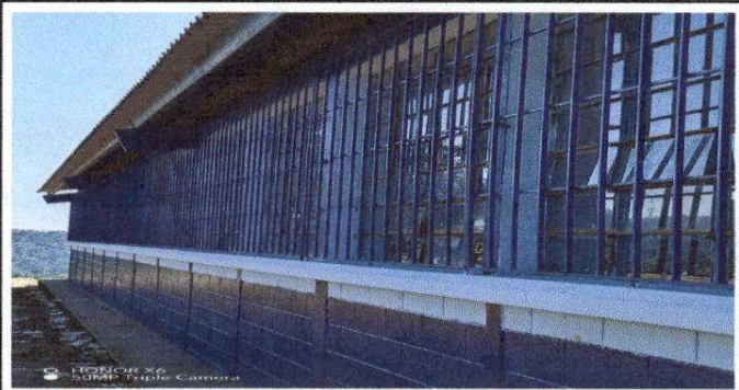
Foto 3: Sustrucción de vidrios y mantenimiento a balcones de metal de la parte exterior de todo el establecimiento.